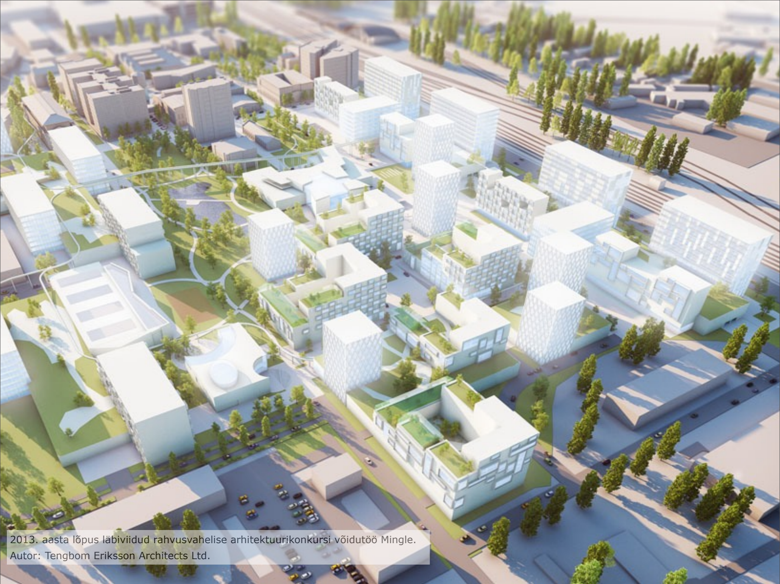
2013. aasta lõpus läbiviidud rahvusvahelise arhitektuurikonkursi võidutöö Mingle. Autor: Tengbom Eriksson Architects Ltd.